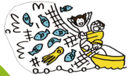
定置網あみあげ体験