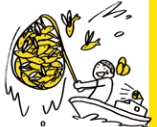
観光トビウオすくい