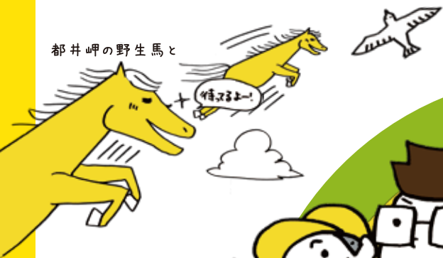
都井岬の野生馬と